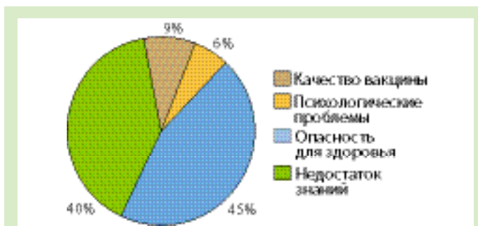
Рис. 1. Частота указания причин отказа от вакцинации

Анкета содержала 2 группы вопросов. Вопросы 1-й группы задавались с целью выявления причин отказов; чаще всего определялись следующие причины: опасение за здоровье детей; дефицит знаний родителей о необходимости вакцинации; сомнения в качестве вакцины; психологические проблемы (религиозные убеждения) – рис. 1. На непрофессионализм медсестры и недостаточно хорошую организацию работы городской детской поликлиники №1 Красноярска не указывалось, что свидетельствует о высоком уровне доверия родителей медсестре, положительном отношении к деятельности данного лечебно-профилактического учреждения (ЛПУ) и позволяет обеспечить высокие показатели охвата вакцинопрофилактикой.