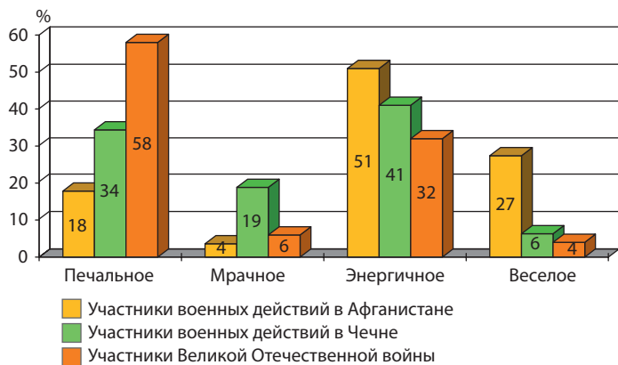
Рис. 1. Характеристика настроения пациентов

Посттравматический стресс – это объективное состояние, возникшее в ответ на стрессогенную ситуацию. Посттравматический стресс обусловлен индивидуально-психологическими особенностями личности, эмоциональной и психологической реакцией индивидуума на окружающую действительность и характеризуется болезненными, шокирующими переживаниями, нарушениями сна, социальной отчужденностью, раздражительностью, злоупотреблением алкоголем или наркотиками, депрессивным настроением, суицидальными мыслями, высоким уровнем тревожной напряженности или психологической неустойчивости.